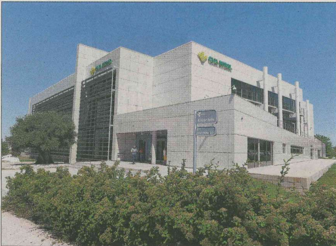
ARCHIVO. Sede de la Caja Rural de Jaén, instalada en el Parque Tecnológico de Geolit en Mengíbar.

Unos requisitos que, de acuerdo con el criterio de todos los miembros del jurado que ha otorgado este galardón, cumple a la perfección una entidad como Caja